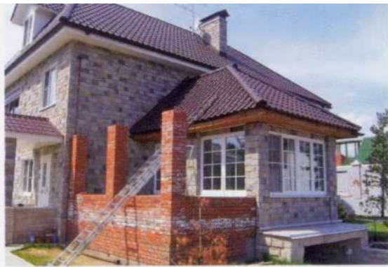
Кирпичный дом, облицованный декоративным камнем.

приступать к отделке. Дело в том, что разные участки стены могут иметь разную влажность – она должна по возможности выровняться.