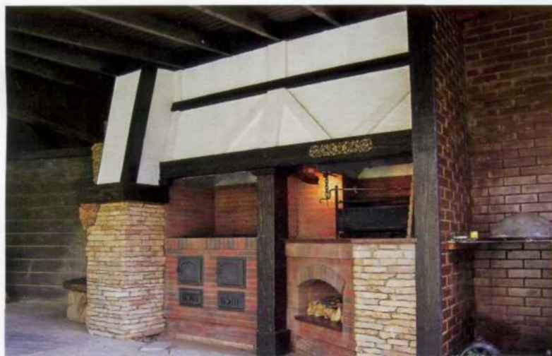
Уличный камин-печь-мангал «Грюнвальд». Проект и изготовление – мастерская LEGE ARTIS. Архитектор, скульптор – В. Бабин, конструктивная разработка – М. Толкачев, ковка – М. Матвеев