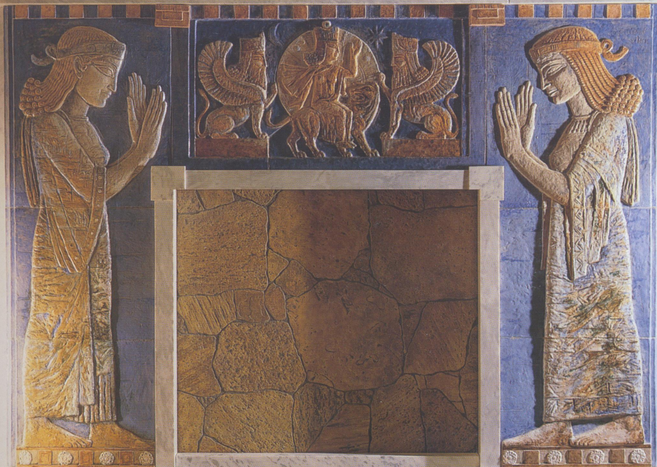
Камин «Вавилон» (1997 г., скульптор В. Бабин)