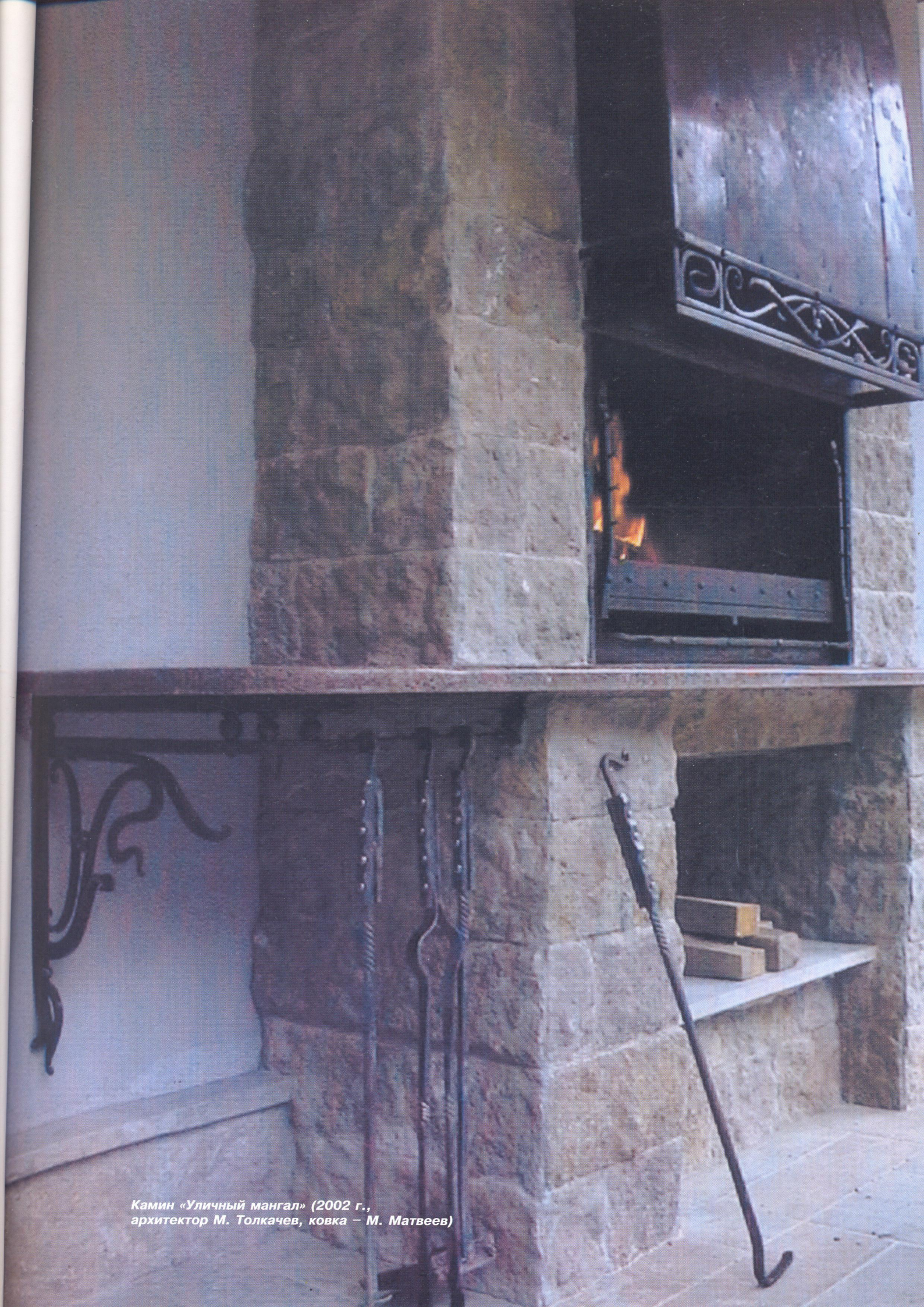
Камин «Уличный мангал» (2002 г., архитектор М. Толкачев, ковка – М. Матвеев)