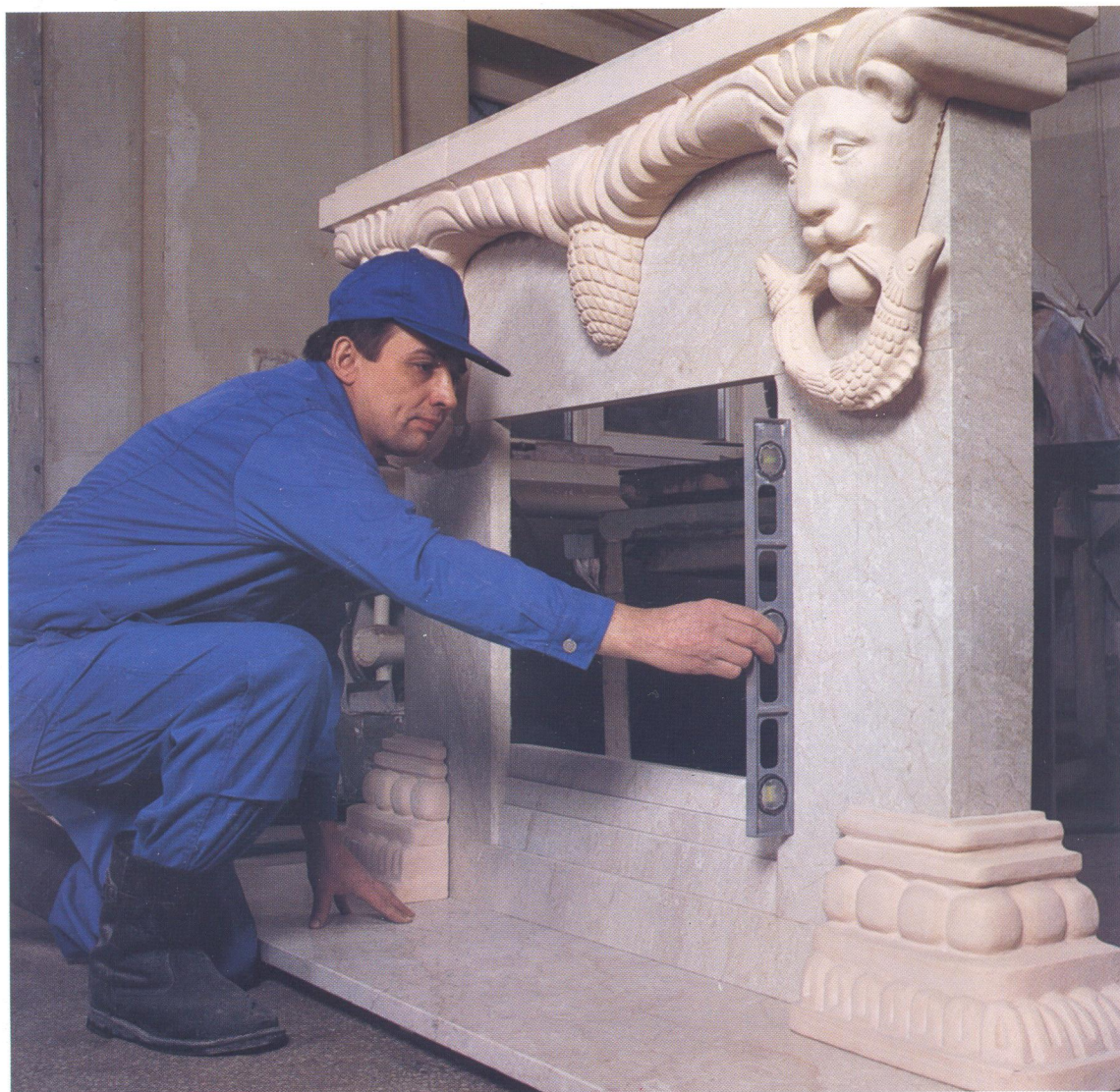
Камин «Львы» (1999 г., авторы А. Марков, Т. Жукова)

Фирма выполняет заказы не только на проектирование и изготовление каминов, но и на отдельные работы (уста-