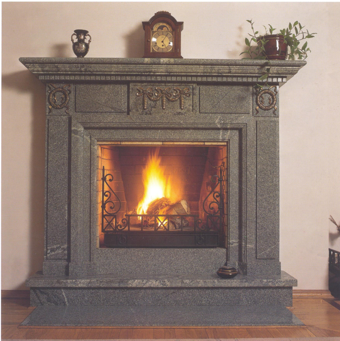
Камин «Монарх» (1995 г., архитектор М. Толкачев, скульптор А. Черноусов)