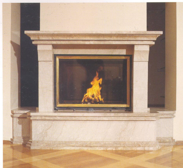
Камин «Янус» (1998 г., дизайнер М. Чопорняк)

За рубежом построить камин по индивидуальному проекту стоит несоизмеримо дороже, чем установить стандартное фабричное изделие с типовой облицовкой. Наш же заказчик получит и оставит наследникам уникальное произведение искусства за цену, вполне сопоставимую с ценой импортного камина. В некоторых случаях наша цена может оказаться даже ниже. Кстати, цена, точнее, ценность авторского камина и, соответственно, дома, который он украшает, с течением времени неуклонно растет.