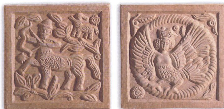
Изразцы «Полкан», «Птица Феникс» (автор Т. Жукова)

Как уже было сказано, он полезен в тех широтах, откуда этот товар экспортируют, где он может быть единственным в доме источником тепла те 2-3 месяца, когда необходимо более или менее регулярное отопление. Например, средняя температура января в Мадриде +4°C, в Париже и Лондоне +3°C, в Риме +8°C, а в Москве -18°C. В Западной Европе нет месяца, средняя температура которого была бы минусовой. В Москве же таких месяцев - пять в году.