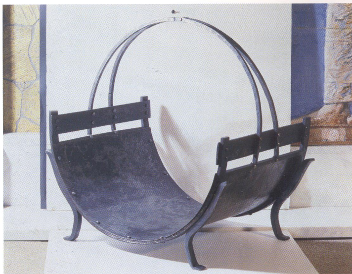
Дровница кованая (авторская ковка – М. Матвеев)

сультацию о правилах устройства разных видов каминов и дымоходов. Специалистами фирмы разработана классическая топка английского типа, выложенная ог-