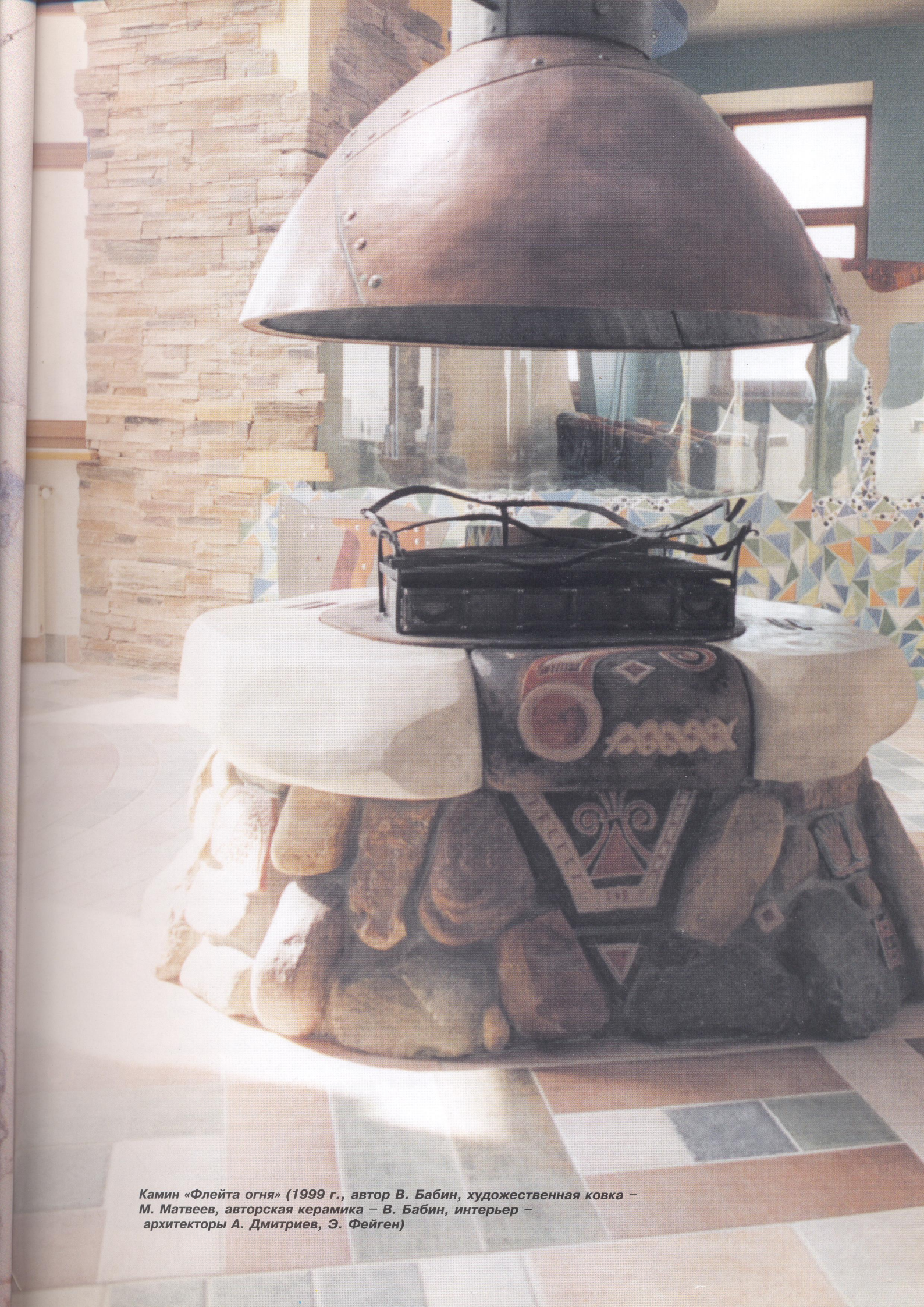
Камин «Флейта огня» (1999 г., автор В. Бабин, художественная ковка – М. Матвеев, авторская керамика – В. Бабин, интерьер – архитекторы А. Дмитриев, Э. Фейген)